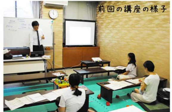
前回の講座の様子

ご希望のクラスを選び、お申込みください。応募者多数の場合は抽選とし、抽選もれの方は受講できないことやクラスを移動して頂くことがあります。 受講決定については締切日2日後までに「受講通知メール」でお知らせします。メールが届かない方はお電話ください。